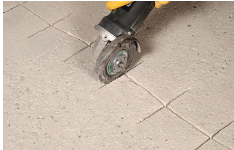
Obr.č.1: Narezanie škár okolo praskliny

epoxidová dvojzložková sada na „zošívanie“ prasklín v cementových poterach