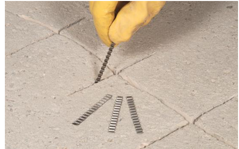
Obr.č.2: Kontrola správnych rozmerov škár