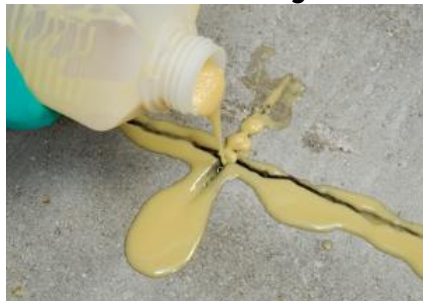
Obr.č.5: Doplnenie škár epoxidovou živicu