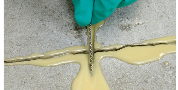
Obr.č.4: Vloženie spôn do vyliateho epoxidu