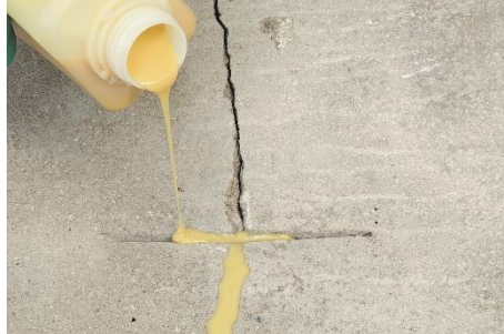
Obr.č.3: Vyplnenie škár weberfloor Blitzharz easy